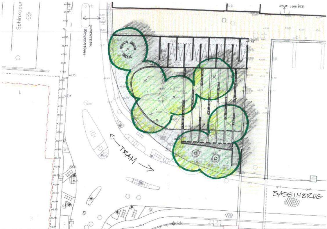
Referentiebeeld groene trap