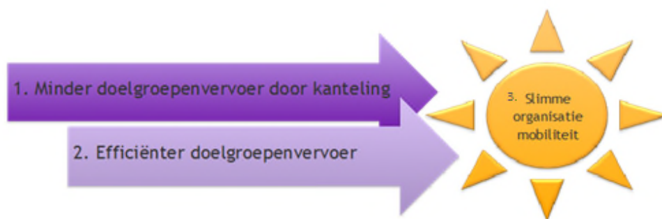
Figuur 2: Visualisatie visie Omnibuzz

De visie van Omnibuzz om dit te realiseren leunt op drie belangrijke pijlers, 1. Het kantelen van vervoer en OV gebruik stimuleren; 2. Het efficiënter organiseren van doelgroepenvervoer en 3. Aansturing door een slimme organisatie.